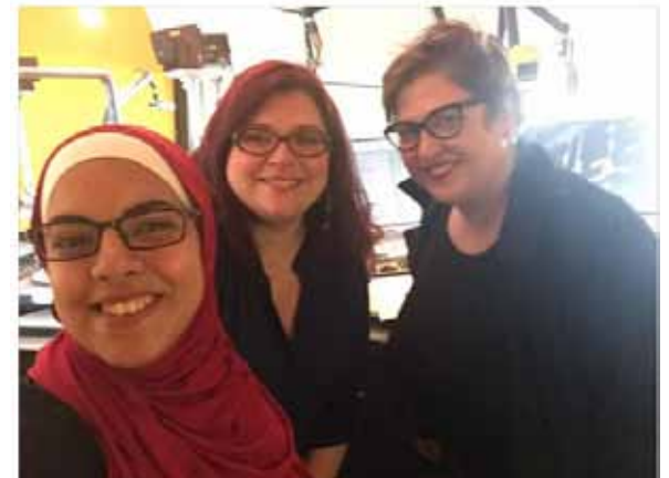
Take The Cake: Fat Babes In Vienna